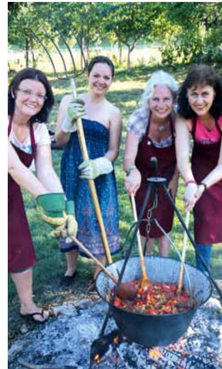
Das Küchenteam sorgt für das leibliche Wohl

Bei Überweisung des Gesamtbetrags (Unterkunft, Verpflegung, Seminarbeiträge) bis zum 31. Mai 2017 (Datum Zahlungseingang) erhältst du einen Frühbucherrabatt in der Höhe von 10 % des Gesamtbetrags, den du gleich bei der Überweisung abziehen kannst.