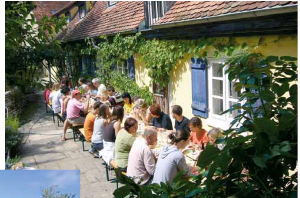
Gemeinsames Essen im Freien

Es bietet eine wunderbare regenerierende, inspirierende Atmosphäre, sehr schöne Räume und liegt in dem ruhigen kleinen Ort Meinheim nördlich von Treuchtlingen im Altmühltal. Der verwunschene Garten und die unmittelbare Umgebung komplettieren seinen Zauber. Es liegt in der Nähe von Wolfsbronn, wo man das Naturphänomen »Steinerne Rinne« besuchen kann. Einige Seen, wie der Hechlinger See oder der Altmühlsee bei Gunzenhausen, sind nicht weit entfernt und laden zum Baden ein.