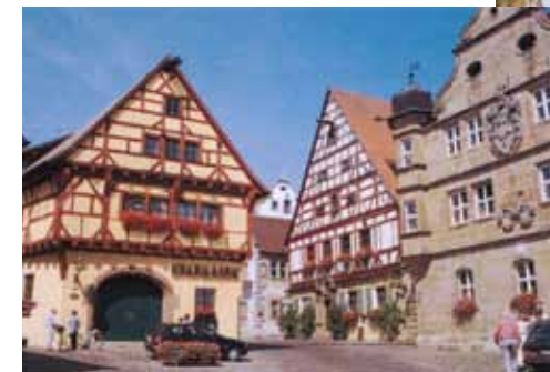
Wolfram-von Eschenbach- Platz mit dem ehemaligen Deutschordenschloss

Nütze diese einzigartige Gelegenheit und besuche das Philo-Camp 2017 in unserem Seminarhaus Camelot, bei dem wir wieder ein abwechslungsreiches Programm anbieten.