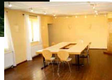
Großer Seminarraum Singen am Lagerfeuer