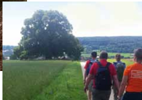
Paddeln im Kanu auf der Altmühl Hohlweg bei Hechlingen Wanderung zur Hundertjährigen Linde

Das Altmühltal selbst ist eine der schönsten Regionen Deutschlands und wohl auch deshalb unser zweitgrößter Naturpark.