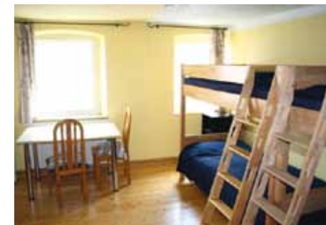
Freundliche 2- bis 6-Bettzimmer