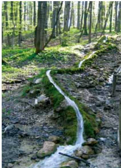
Die »Steinere Rinne« bei Wolfsbronn