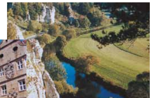
Das Altmühltal bei Dollnstein/Solnhofen