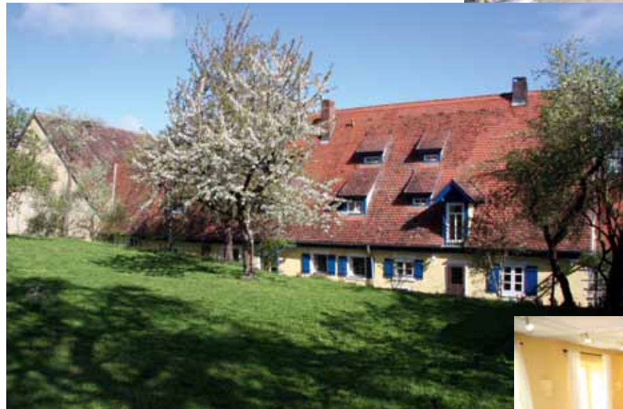
Camelot, ein wunderschönes, herrschaftliches fränkisches Bauernhaus